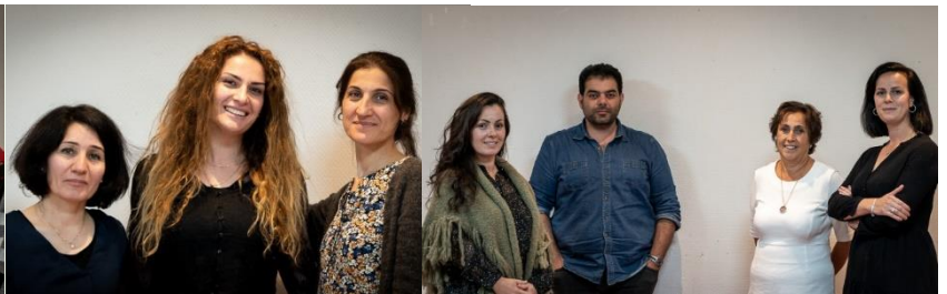
MiR Øvre Romerike